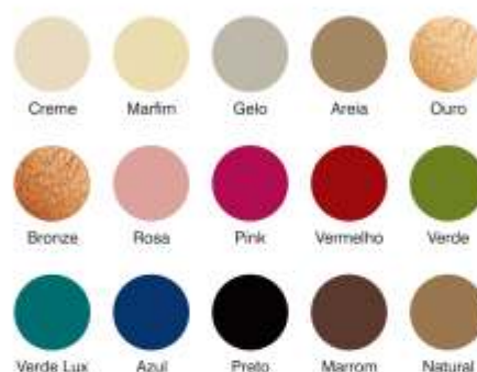
Tabela Cores Couro Reconstituído

As cores dos produtos podem variar em relação às cores aqui apresentadas. Para o desenvolvimento de novas cores, consultar o departamento comercial.