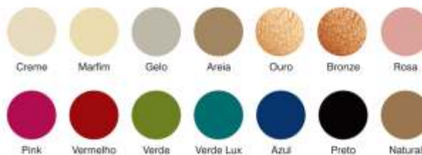
Tabela de Cores Sintético