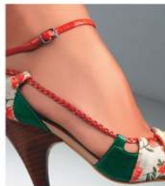
Tabela de Cores Sintético