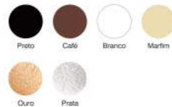
Tabela de Cores Sintético

As cores dos produtos podem variar em relação às cores aqui apresentadas. Para o desenvolvimento de novas cores, formatos e larguras, consultar o departamento comercial.