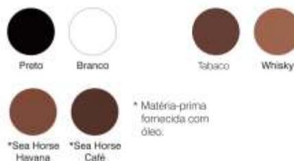
Tabela de Cores Culatra

As cores dos produtos podem variar em relação às cores aqui apresentadas. Para o desenvolvimento de novas cores e larguras, consultar o departamento comercial.